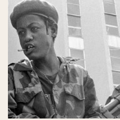
Mengistu Haile Mariam